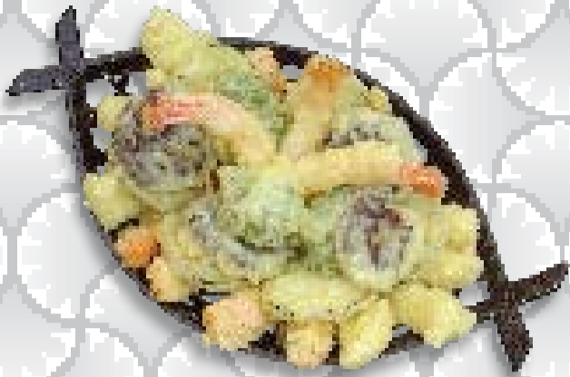
Warzywa i owoce morza w panierce TEMPURA na głębokim oleju